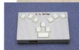
視覚障害者向け6点入力式簡易メモ装置