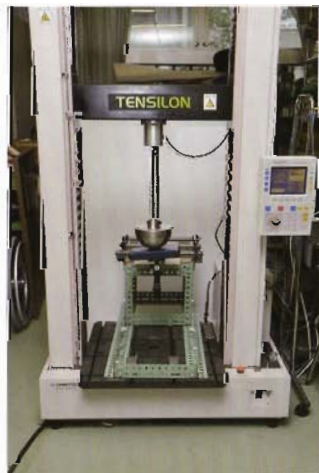
座位保持装置頭部支持部の後方静的荷重試験