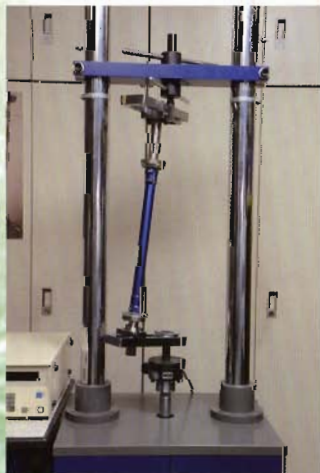
義足一体構造耐久試験機