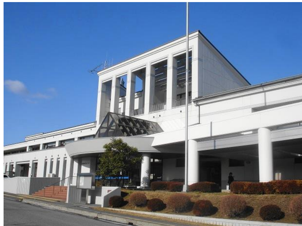
ホームページより掲載