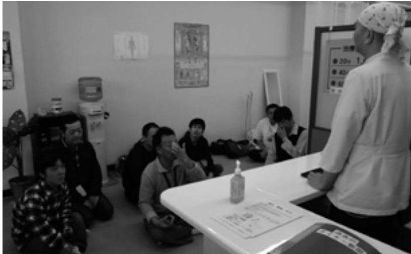
タイケー治療室での見学風景