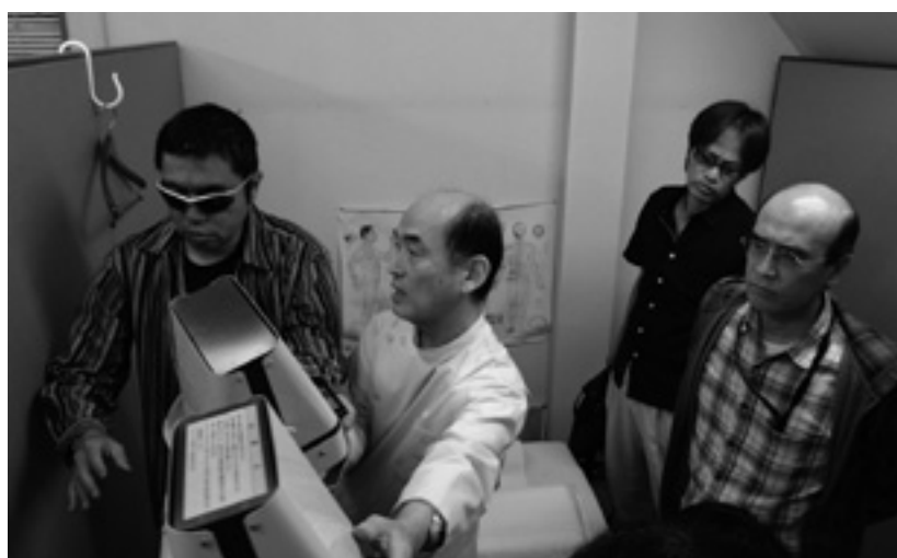
久米川鍼灸院での見学風景

その反面、「もっと時間がほしかった。」「もっといろいろな施術所を見てみたい」などのご意見も頂きましたので、来年度以降の参考にしたいと思います。