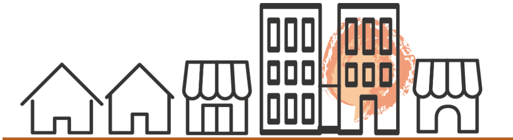
モール型イメージ図

代金は、モール側が集金し、決められた日にまとめて作家に支払われます。その際、商品の販売手数料と売り上げの振込手数料が売価から差し引かれます(詳細は各々ショップの規約によります)。