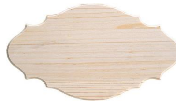
フレンチプロビンスシャルサインL