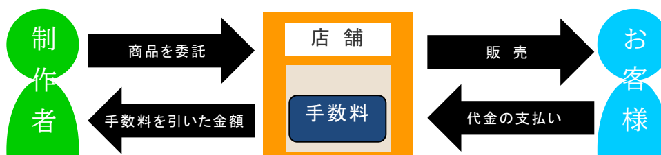
(参考) 委託形式の商品とお金の流れ

委託形式に適した作品ジャンルとしては、平筆静物画、風景画、オイル技法の作品などで、同じものを制作するのが難しく、かつ制作時間が長く単価が高めになる作品などが適しているでしょう。特に、1点物の作品は展示方法によっても売れ行きに差が出る場合があります。見やすい高さや場所についても店舗側とよく相談して決める必要があります。