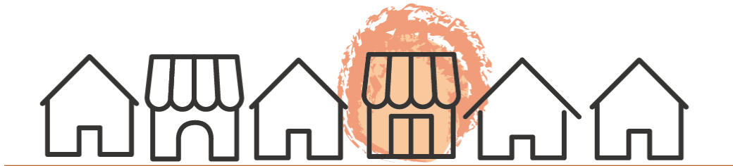
自社サイト型イメージ図

一から自分で作り上げ、ショッピングカートサービスなどを利用して、独立した販売を行う形態です。自由度はとても高いですが、ショップの作りこみや管理システム、集客や、セキュリティのことなど多岐にわたった知識が必要です。