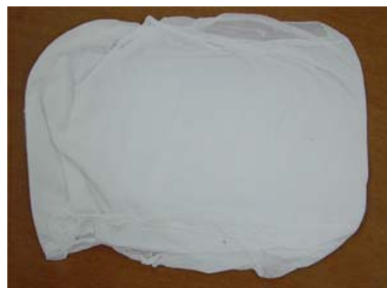
図2 試作したサポーター形状の発汗吸収シート