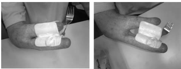
図 1 これまで使用していた自助具

切断者の調理への意欲はさらに高く、生野菜を切るために包丁(図 5a)の改良も希望した。当初は全盲の切断者が包丁を使うことに対して危険性が危惧されたが、医師の処方の下、数回のシミュレーションを経て試用評価を行い、またその動作と安全性について作業療法士とともに確認を