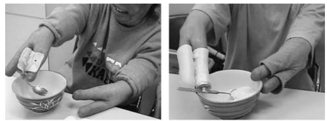
図 3 食事時の姿勢の変化