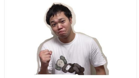
まずは測ってみることからです