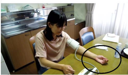
手のひらは上を向けます