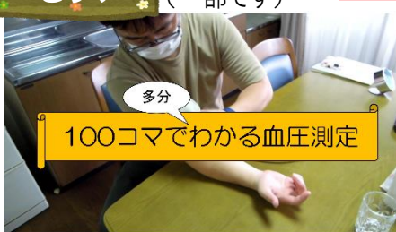
100コマでわかる血圧測定