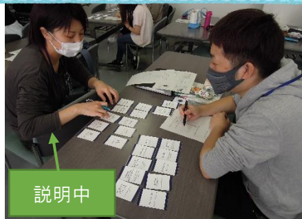
選んだカードを説明