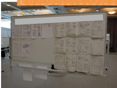
模擬事例で看護過程を展開