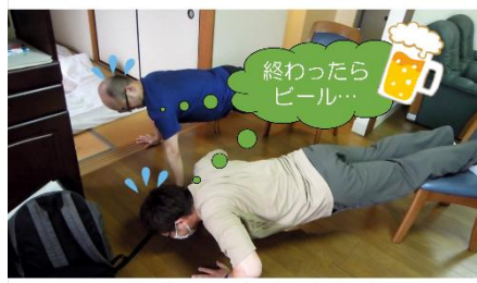
集中して行うよりも