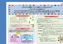
リーフレット(A4両面1枚)