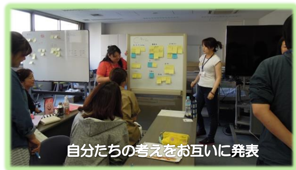
自分たちの考えをお互いに発表