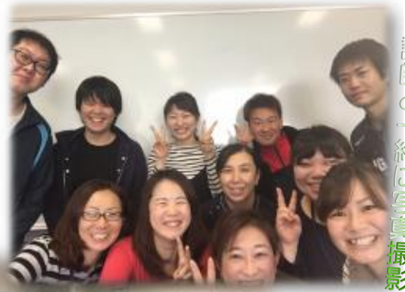
講師と一緒に写真撮影