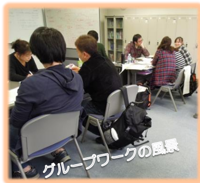
グループワークの風景