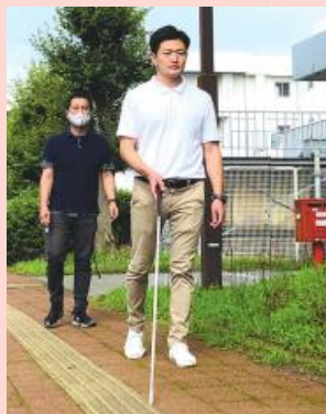
白杖を使用した歩行

屋内・外を安全に歩行できるように、建物内の移動方法や移動の介助を受ける方法、「白杖」の基本操作技術を訓練します。また、電車やバス等の公共交通機関の利用方法も訓練します。