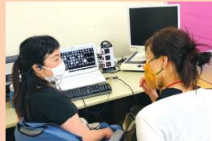
拡大ソフト及び音声機能を活用したパソコン訓練

画面を見ながら操作する代わりに、音声読み上げソフトを使用しパソコン操作ができるように訓練します。また、見えづらい方には画面の拡大ソフト等を使って、パソコン操作の訓練も行います。