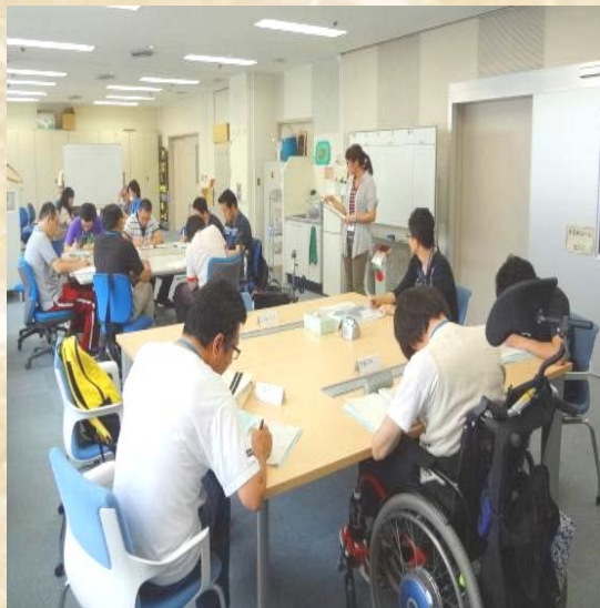
スケジュール管理 (朝、夕)